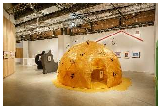
東京会場 展示風景