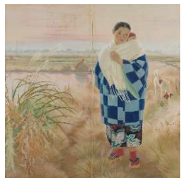
金子孝信《子守り》1938年頃 ([新収蔵]金子孝信とその時代より)

展示室1 「[新収蔵] 金子孝信とその時代」 展示室2 「小さなものたち」 展示室3 「近代美術館の名品」