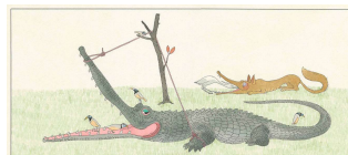
「オオカミとサギ」「きつねがひろったイソップものがたり」より 1987年©空想工房 画像提供：津和野町立安野光雅美術館